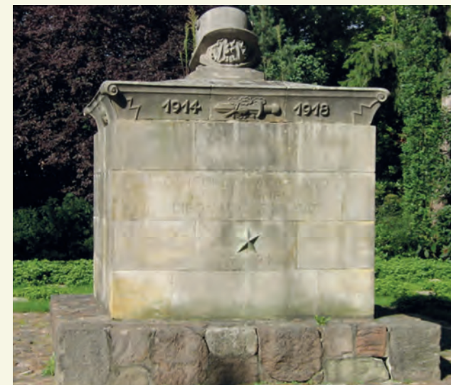
Gefallenendenkmal Zentralfriedhof Lüneburg

Die Revolution 1918 markiert einen tiefen Einschnitt in der deutschen Geschichte. Der militärische Zusammenbruch