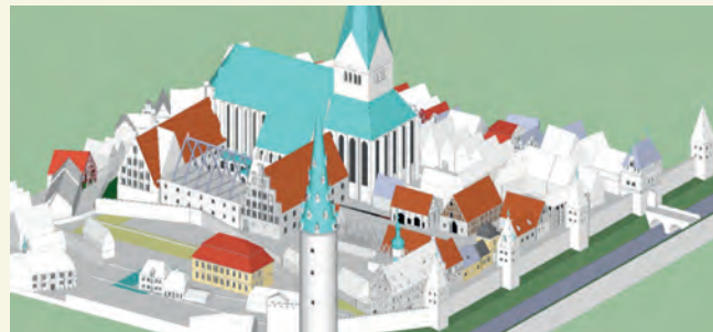
3D-Modell der Klosteranlage St. Michaelis

1371: Lüneburger Bürger erstürmten den Kalkberg und schleiften die Burg; das Kloster wurde intra muros verlegt. Schrittweise seit 1376 erweitert umfasste die Klosteranlage von St. Michaelis am Ende des 18. Jh. mit mehr als 20.000 m 2 die größte zusammenhängende Fläche innerhalb des Lüneburger Mauerrings. Dies, der umfangreiche Immobilienbesitz des Klosters und nicht zuletzt der ambitionierte, heute seiner einst reichen Ausstattung fast völlig beraubte Kirchenbau selbst stellen die Frage nach der Organisation und Nutzung der sakralen Raumgefüge und ihrer Entwicklung nach 1376 – die auf der Basis von Baubestand sowie überlieferten Schrift- und Bildquellen beantwortet werden soll.