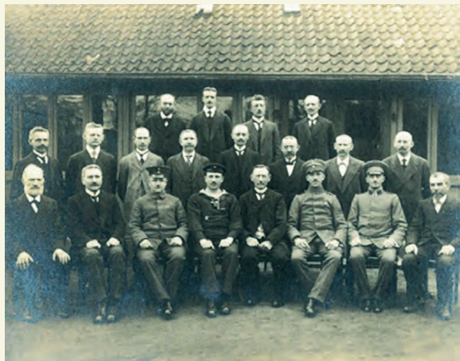
Arbeiter- und Soldatenrat Lüneburg 7.12.1918 – 31.3.1919

Auch in Lüneburg etablierte sich ein Arbeiter- und Soldatenrat. Dieses Ereignis gibt Anlass aus heutiger Sicht zu