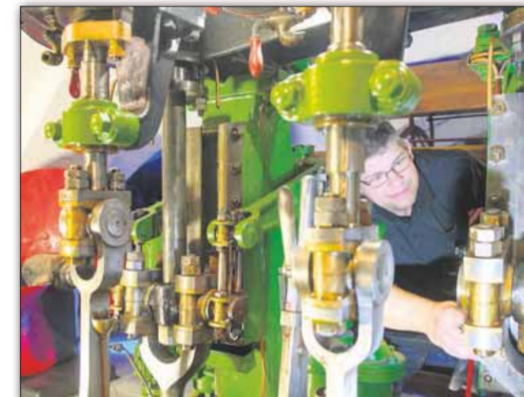
Das Elbschiffahrtsmuseum hat Vorträge und Aktionen im Angebot.