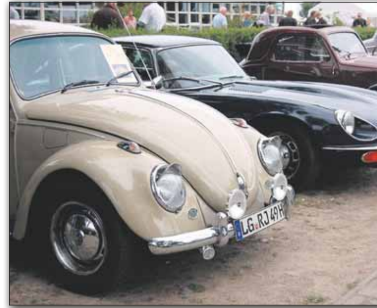
Oldtimer sind im Freilichtmuseum am Kiekeberg zu sehen.