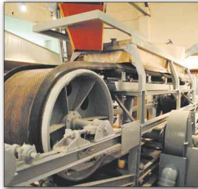
Im Deutschen Salzmuseum gibt es einen Blick hinter die Kulissen.