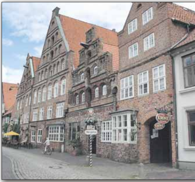
Das Brauereimuseum in Lüneburg bietet kostenlose Führungen an.