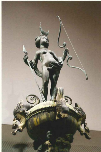
Original des Lunabrunnens

Konto: IBAN DE84 2405 0110 0000 0500 96 bei der Sparkasse Lüneburg