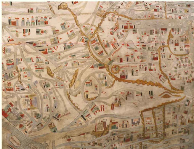
Ausschnitt aus der Ebstorfer Weltkarte